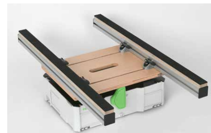
Dank Adaptern sind die Buche Multiplexplatten sowohl mit Systainern ...

Der Kombiadapter besteht aus einer Multiplex-Platte mit Nutenbild. Er wird mit den Systainern einfach per T-Lock oder mit dem klassischen Schnappverschluss verbunden. Bei den L-Boxxen erfolgt die Verbindung durch einmaliges Aufschrauben. Schon hat der Nutzer eine stabile und komfortable Basis für seine Arbeiten, z.B. mit der Handkreis- oder Tauchsäge.