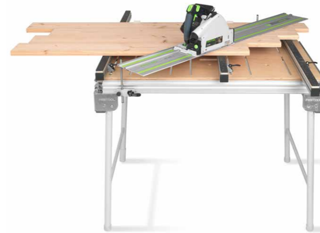
RUWI Multiplex-Montageplatte im Einsatz auf Festool MFT3

Die ebenfalls neu erhältliche Multiplex-Montageplatte mit Nutenbild, für den weitverbreiteten Festool MFT3-Tisch, schafft erlebbaren Mehrwert. Mit der Platte lässt sich die erfolgreich am Markt eingeführte werkzeuglose RUWI-Spanntechnik problemlos von der Werkstatt auf den mobilen Einsatz übertragen.