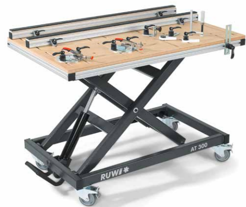
Hubtischmodelle AT 300 von RUWI mit verschiedenen Arbeitsplatten

Mit dem bis zu 300kg belastbaren Hubtischmodell kann die Arbeitsfläche zwischen 45 und 105 cm stufenlos in der Höhe verstellt werden. Eine hochwertige, leichtgängige, hydraulische Fußpumpe bringt sie immer auf die richtige ergonomische Höhe. Vier Vollgummi-Lenkrollen mit Feststellern machen den Tisch äußerst wendig und verhelfen ihm beispielsweise als Montagetisch, Ablagehilfe und Stapelwagen zu großer Mobilität. Das stationäre Beintischuntergestell ist mittels Stellfuß ebenfalls um 6 cm höhenverstellbar.