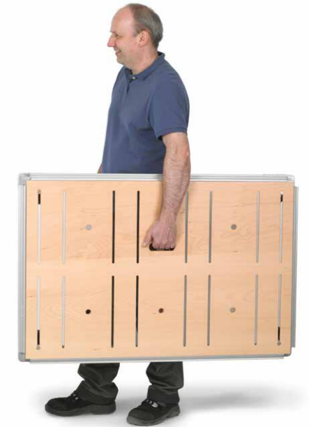
Äußerst mobil – darum immer dabei. Ein eingefräster Tragegriff sorgt für die notwendige Mobilität