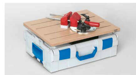
... als auch mit L-Boxxen, beispielsweise von Sortimo, Bosch, u.s.w. kompatibel