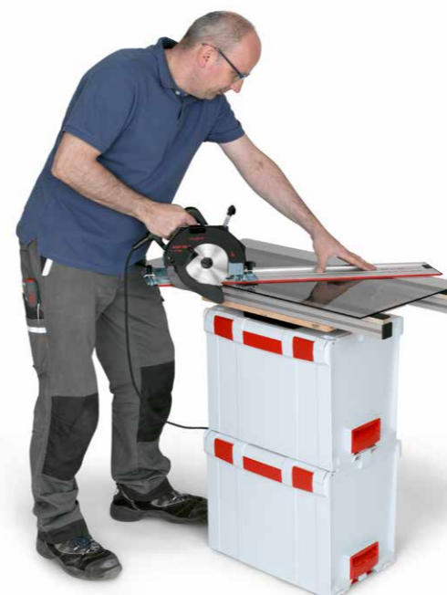
Komfortabel arbeiten mit L-Boxxen und Flächenadapter