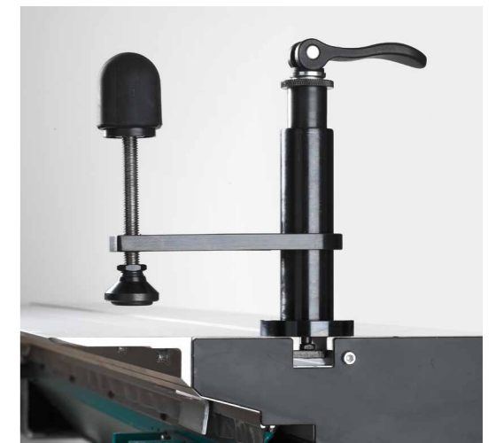
Für alle gängigen Tischkreissäge Modelle verwendbar – Nutensteine fixieren die Spannzylinder

Die Komfortvariante Set 2 (oben rechts) enthält zusätzlich zur Standardausrüstung zwei Hilfsanschläge schmal und einen zweiten Schwenkspanner zur Werkstückklemmung.