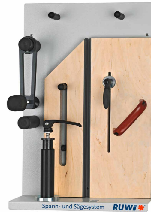
Ordnungspaneel Set Standard