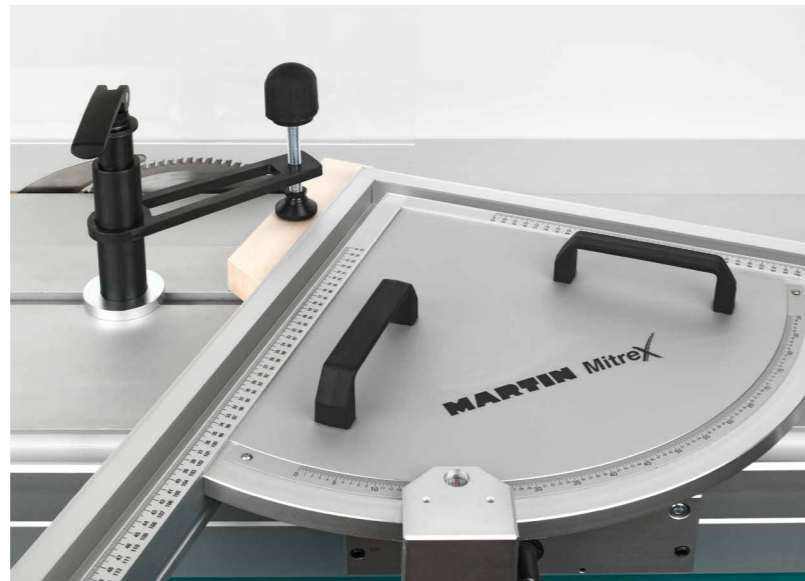
Der RUWI-Schwenkspanner ist auch für bestehende Anschläge eine Bereicherung

Werkzeuglos, drücken, drehen und fixieren – einfacher geht's nicht und die Hände bleiben aus der Gefahrenzone